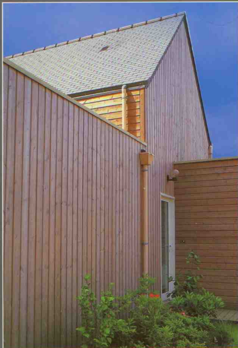
Silverwood Classic - Sapin du Nord - Montana

Sapin du Nord traité Classe 3 - Pin Rouge du Nord traité Classe 4