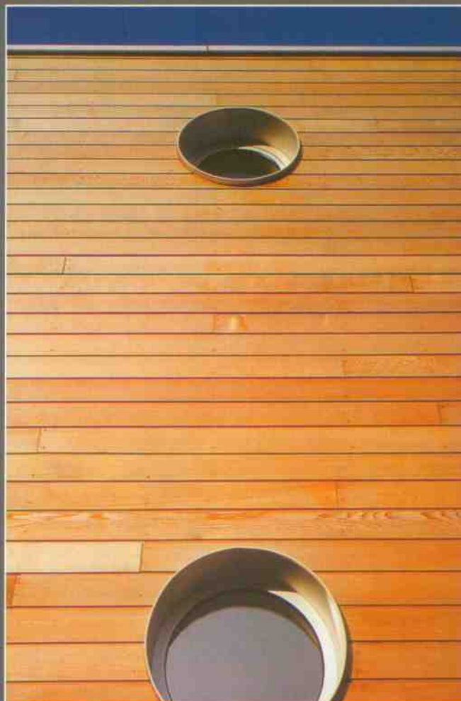
Silverwood Classic - Mélèze - Oural