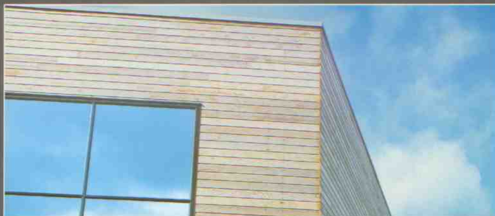
Silverwood Classic - Red Cedar - Saint Louis