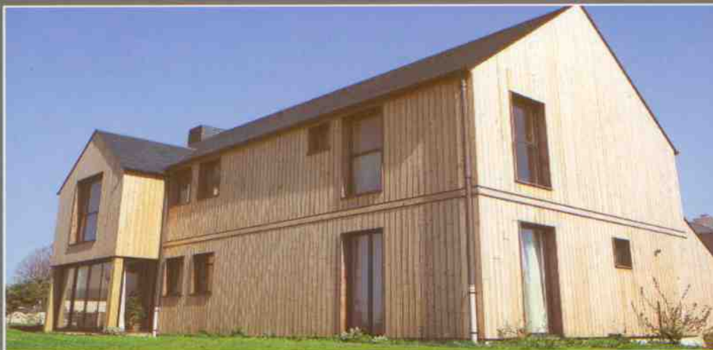
Silverwood Classic - Sapin du Nord - Louisiane