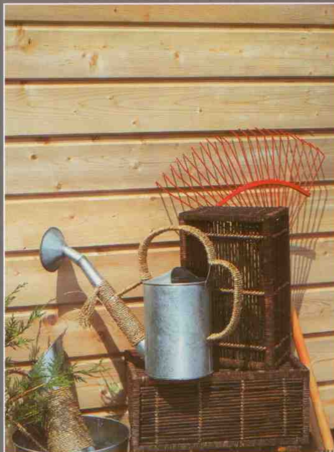
Silverwood Classic - Sapin du Nord - Moutiers